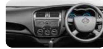
آرام دے انٹیریئر کیبن