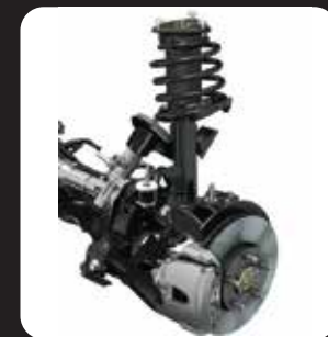
FRONT MACPHERSON SUSPENSION DISC BRAKES (WITH VACUUM BOOSTER)