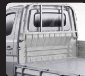
INTEGRATED CABIN AND DECK FOR BETTER STABILITY