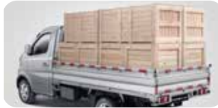
ایک ٹن وزن کی گنجائش۔

اس لیے چنگان آٹو لایا پاکستان میں تیار کردہ (M9 SHERPA) پک اپ، جس میں پاکستان کا سب سے طاقتور C10 1000cc انجن یورو 4 ٹیکنالوجی کے ساتھ، 16 والو اور DOHC جو 68HP اور 92NM ٹارک پیدا کرتا ہے۔ 5 اسپید گیئر ڈبل ٹاپ دے چھوٹے اور لمبے روٹ کے لیے بہترین ایندھن کی بچت، یہ با آسانی 1 ٹن وزن اٹھائے اور اس کا تین طرف سے کھلنے والا 9x5 فٹ کا ڈالا دے زیادہ لوڈنگ کی گنجائش اور زیادہ نفع، خوبصورت انٹیریئر، آسان اسٹیرنگ آپریشن اور ویکٹیو بریک بوسٹر دے آپ کو پر اعتمادی آرامدہ اور آسان ڈرائیونگ، (M9 SHERPA) دے آپ کو 3 سال 60,000 کلومیٹر وارنٹی اور ملک بھر میں پھیلا وسیع 3s ڈیلرز نیٹ ورک۔