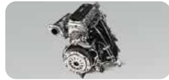
طاقتور C10 1000cc انجن