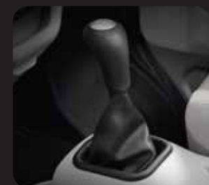
5 SPEED MANUAL TRANSMISSION