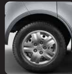
5 LUG NUT 175/70R14 TIRE